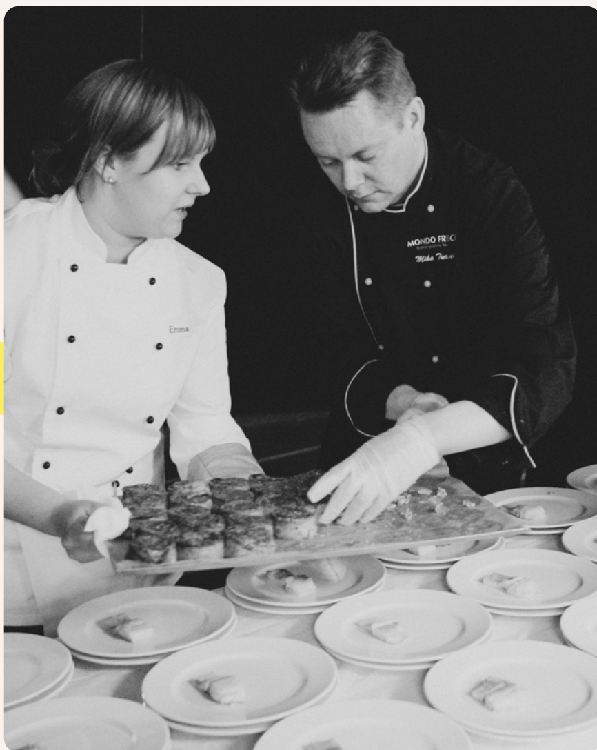
Annosten viimeistelyä 1100 hengen kansainvälisessä iltatilaisuudessa Rovaniemellä 03/2011.

Meille ruoka on intohimo, ei vain ammatti.