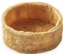
Pieni Leivospohja Pyöreä Lehtitaikina