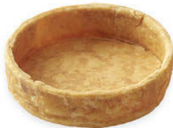
Iso Leivospohja Pyöreä Lehtitaikina