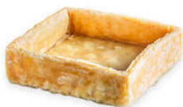
Pieni Leivospohja Neliö Lehtitaikina