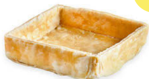
Iso Leivospohja Neliö Lehtitaikina